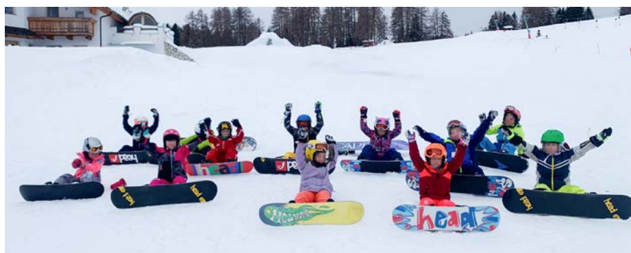
D’inviern possa i mutons y la mutans danter l auter nce purvé ora a furné cun l snowboard.

A chësta maniera ti porten daujin ai mutons plu sortes de sport, i possa udëi ciuna ativeies che ti sà beles a pratiché y sce vel’atività sportiva ti sà manco bela sai che do cin iedesc vëniel inò mudà. L vën pità ativeies dedora sciche l juech al palé, atletica, jì cun la roda, d’inviern pudejé, snowboard, fé a hockey, jadiné artistich y jì cun la luesa, y ativeies dedite coche judo, nudé, fé a tennis, arpizeda y balé.